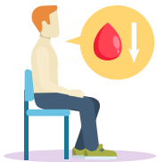
ผู้ป่วยโรคเลือด