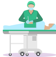
ผู้ป่วยเข้ารับการผ่าตัด