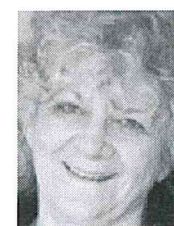
Ada E. Yonath