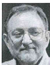
Andrew Zachary Fire