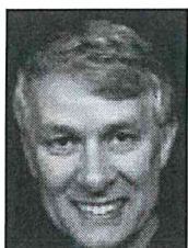
Richard J. Roberts

Japan Science and Technology Agency (JST) Japan