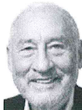
Joseph E. Stiglitz

The Australian National University Australia