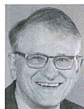
Klaus von Klitzing

Science Council of Japan; The University of Tokyo Japan