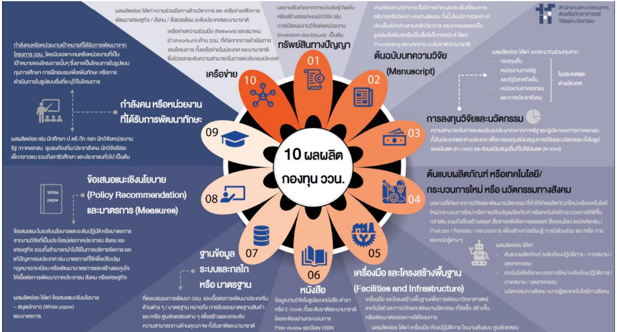
รูปที่ 2 ประเภทและนิยามผลผลิต