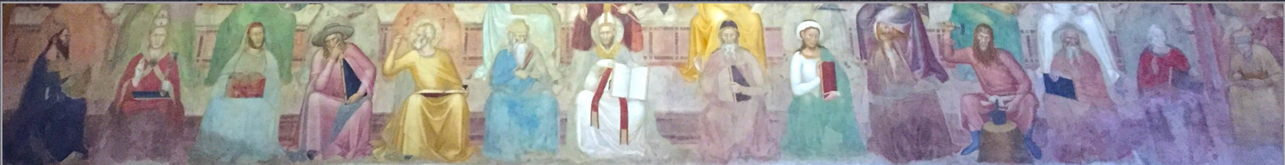
Fresco from Santa Maria Novella, Firenze