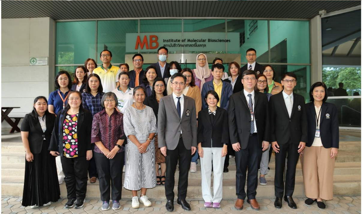
ข้อมูลข่าว: ถวิลวงศ์ คุณาก้องเกียรติ ศิริวัลย์ อัครเมฆิน งานบริหารและส่งเสริมการวิจัย