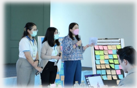
ข้อมูลข่าว: งานบริหารเงินทุนวิจัย