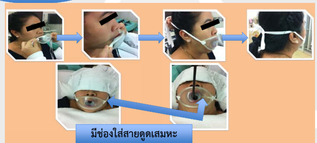
มีช่องใส่สายดูดเสมหะ