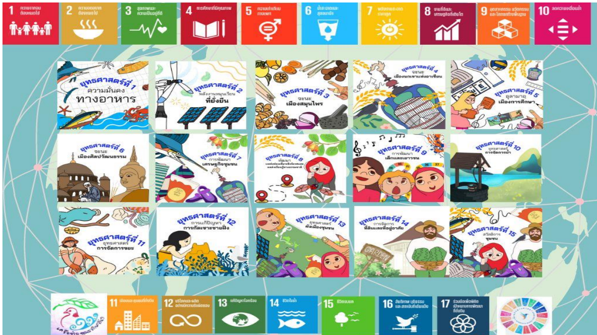
ภาพโดย: พัทธิธีรา นาคอุไรรัตน์