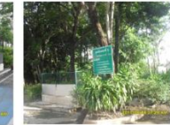
จุดพักขยะที่ 5