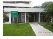
จุดพักขยะที่ 7