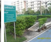
จุดพักขยะที่ 4