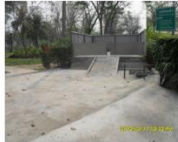
จุดพักขยะที่ 2