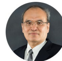
กรรมการ และเลขาธิการ