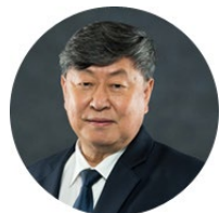
ประธานกรรมการ