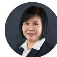
กรรมการ และผู้ช่วยเลขาธิการ