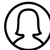
นักทรัพยากรบุคคล ผู้ช่วยเลขาธิการ