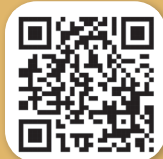
แบบสำนึก ในพระมหากรุณาธิคุณ