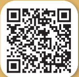
ตัวอย่าง หนังสือขอพระราชทาน