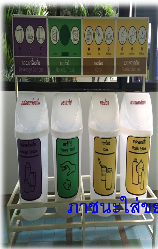
ภาชนะใส่ขยะแบบแยกขยะ

สำนักงานอธิการบดี มีนโยบายในการคัดแยกขยะในองค์กรโดยกำหนดให้บุคลากร มีการคัดแยกขยะและกำหนดให้ปริมาณขยะ Recycle มากกว่าขยะทั่วไป 45 % โดยสนับสนุนภาชนะในการคัดแยกขยะติดตั้งตามพื้นที่ต่าง ๆ ในอาคารสำนักงานอธิการบดี