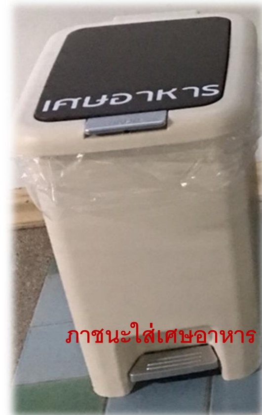
ภาชนะใส่เศษอาหาร