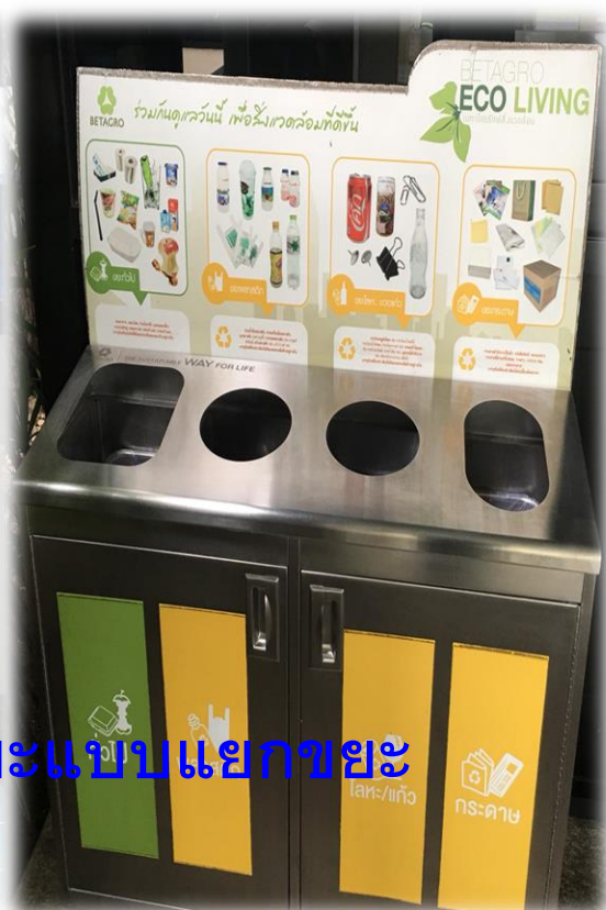
ใส่-แก้ว กระดาษ