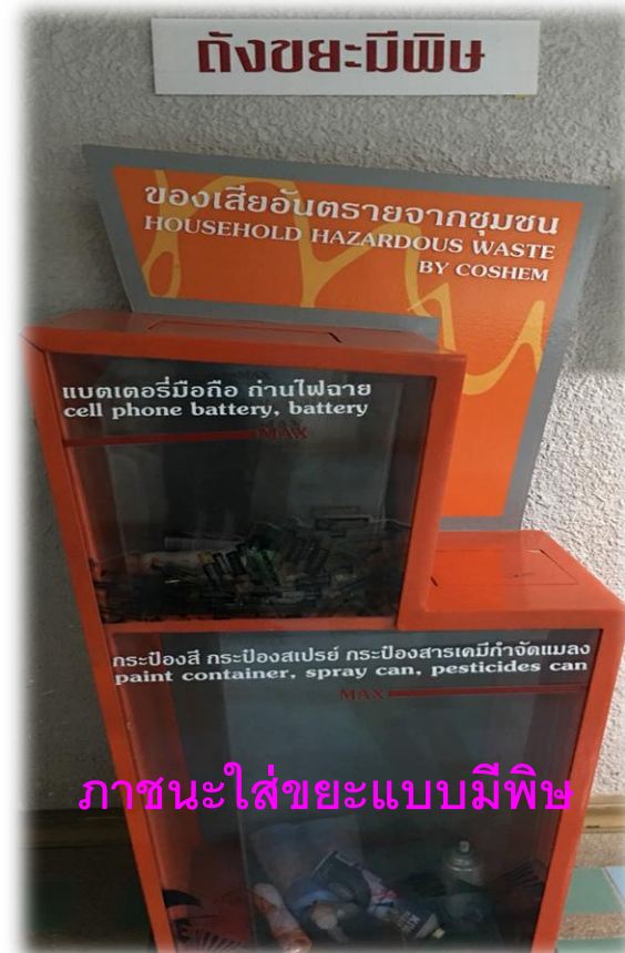
ภาชนะใส่ขยะแบบมีพิษ