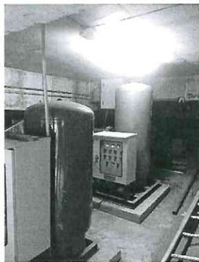
ระบบรดน้ำสวน