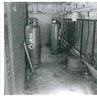
จุดวางถังและท่อส่งแก๊ส