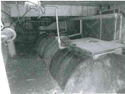
ถังบำบัดน้ำเสีย