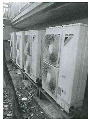
ระบบปรับอากาศของร้านฯ