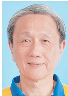
สนพ.ประสิทธิ์ วัฒนาภา