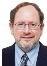
ศ.นพ.จอห์น ดี. คอลลินส์