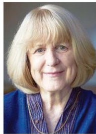
ศ.ดร.แมรี่ แคลร์ คิง